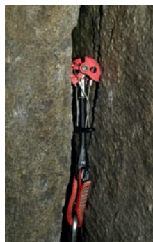
Das Kniehebelprinzip: Bei Zug am Steg nach unten spreizen sich die Viertelkreissegmente nach außen gegen die Wand.